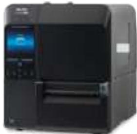
CL4NX Plus с ножом