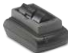
PV3 Зарядное устройство