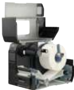
CL4NX Plus с отделителем этикеток

Полный список опций и аксессуаров уточняйте у локального представителя SATO