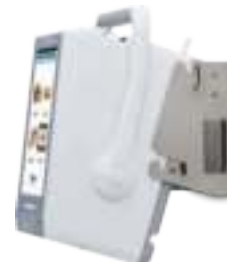
FX3-LX Настенное крепление