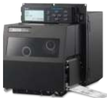
S84-ex RFID (принт-модуль)