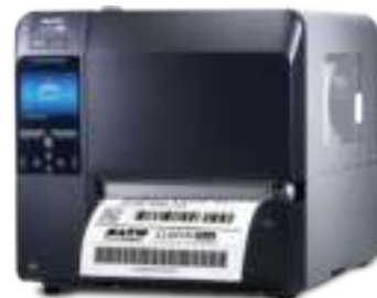
CL6NX Plus RFID