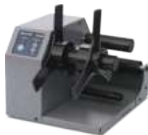
RWG500 Смотчик этикеток