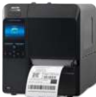
CL4NX Plus RFID